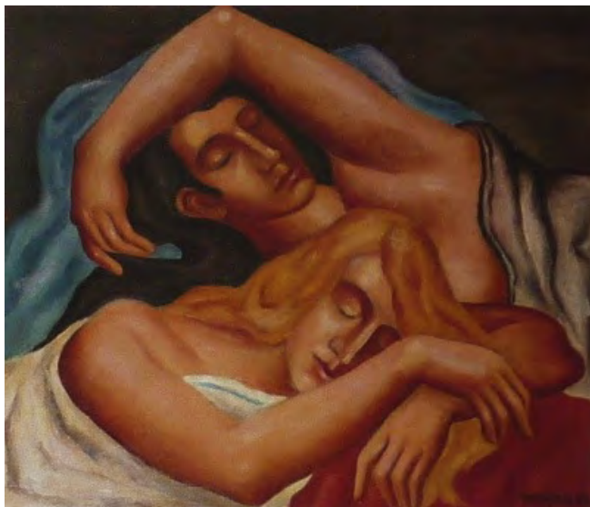
Schlafendes Paar 1929 Öl auf Leinwand, 46 x 54 cm. Privatbesitz

Lit: Der Maler Franz Monjau. Hrsg von Mieke Monjau. Düsseldorf 1993.